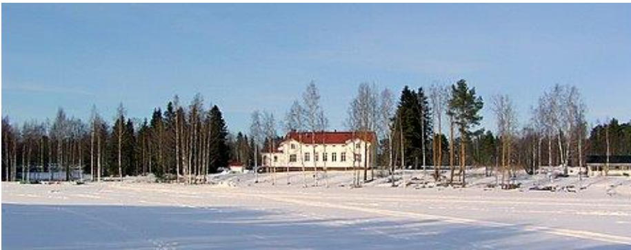
Entisen kirkkoherranpappilan, seurakunnan leirikeskuksen perusteellinen korjaus seurakunnan nuorisotyön tarpeisiin valmistui 2007.