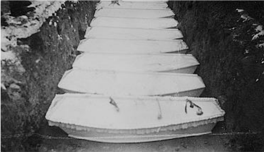
Pyhäjärven kirkkomaahan siunattiin 5.4.1942 yhdellä kertaa 15 sankarivainajaa.