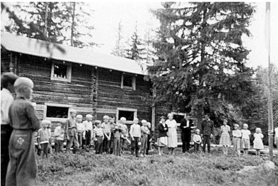
Pappilan piha-aitta siirrettiin 1960-luvun alussa Korhoseniemeeseen seurakunnan nuorisotyön tukikohdaksi.