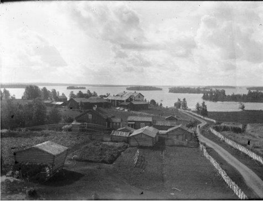
Isopappila on rannalla, etualalla Väisälä, jonka historia alkaa jo vuodesta 1550. Kirkonkylä ja pappila olivat pitäjän keskus 1920-luvulle asti. Rautatie siirsi kunnan hallinnon Pyhäsalmele.