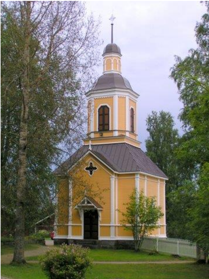
Vuonna 1899 valmistunut tapuli kirkkomaan kulmassa