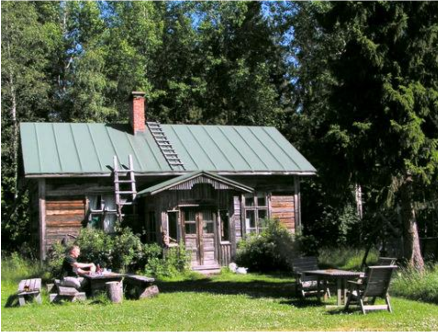
Korhosenniemen Mummon mökissä voivat seurakunnan vieraat yöpyä. Hirret ovat peräisin Vuohdomäeltä Kanervan talosta