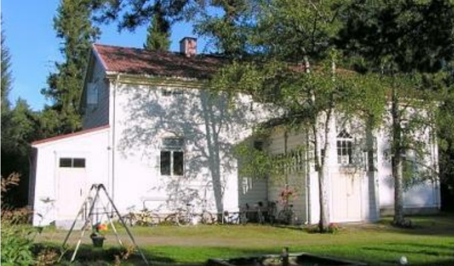
Pitäjänapulaisen virkakartano vuodelta 1864