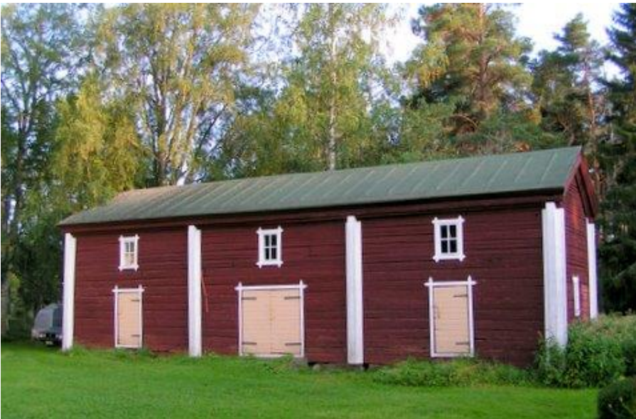
Virkatalojen kymmenistä rakennuksista on pystyssä vain muutama. Tämä on Pikkupappilan piha-aitta.