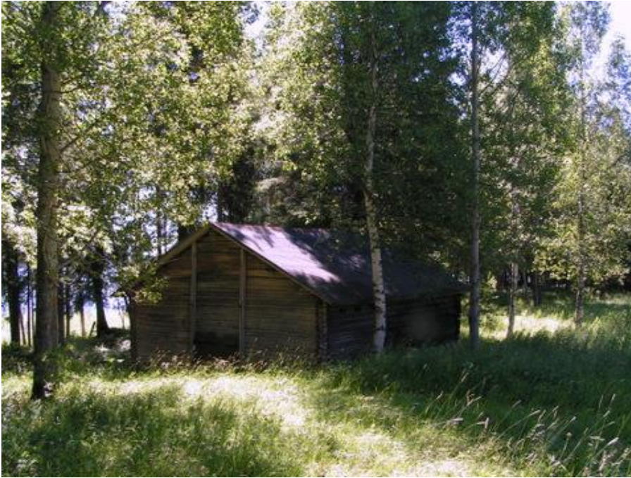
Korhosenniemiessä on vanhasta riihestä tehty hiljentymispaikka, riihikirkko.

Kirkkoherran virkatalon Sammallahti 22 maihin kuuluvassa Honkasaarella oli pappilan kalamaja ja Pirttisaarella pappilan lammasnavetta. Näissä saarissa pidettiin seurakunnan ja partiolippukunta Eräveikkojen yhteisiä kesäleirejä jo 1940-luvulla heti sodan jälkeen. Pappilan peltoa ja riihi olivat Korhosenniemiessä jo 1830-luvulla. Sinne suunniteltiin hautausmaata 100 vuotta sitten, mutta suunnitelmasta luovuttiin, sillä niemi jäi tulvavuosina saareksi.